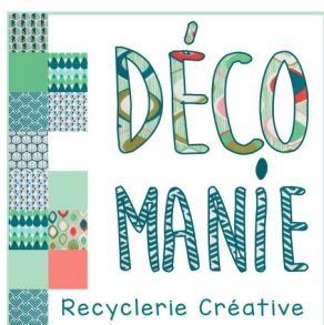
Nouveau service de relooking de volets en bois